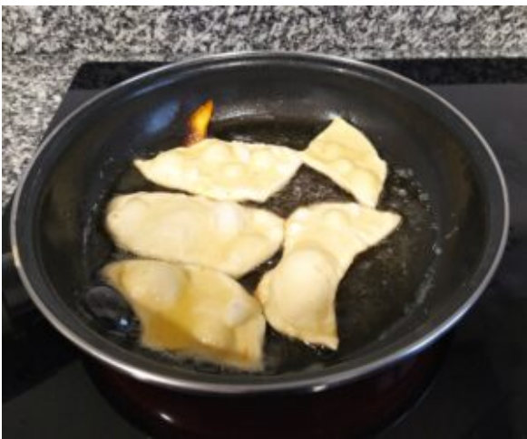
Fritura vuelta y vuelta