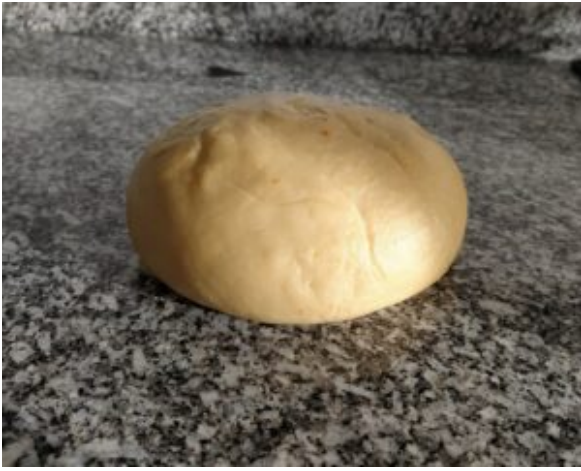
Masa de las orejas